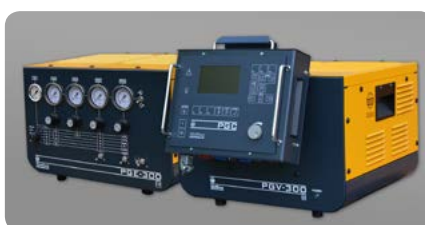
Gasversorgung manuell: PGE-300, automatisch: PGV-300 Gas supply manual: PGE-300, automated: PGV-300