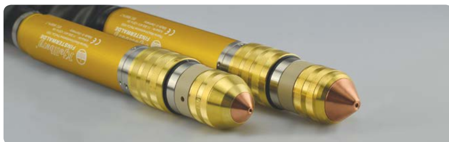
PerCut-Brenner: auch für Fasenschnitte bis 50 ° | PerCut torches: also for bevel cutting up to 50 °

Newly developed gas supply units are available for the Smart Focus series, either manual or fully automated. With these the user achieves best cutting results with highest, reproducible quality. The new torches PerCut 2000 and PerCut 4000 have been improved as well. They provide precise cuts and highest cutting speeds. Their unique cooling system guarantees longest consumable life and reduces the gas consumption and costs per cutting metre.