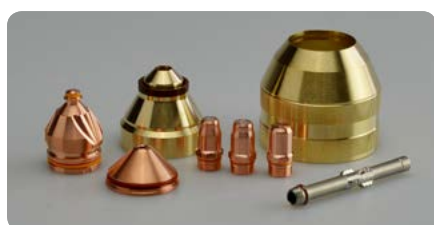
Verschleißteile mit langer Lebensdauer Consumables with long lifetime